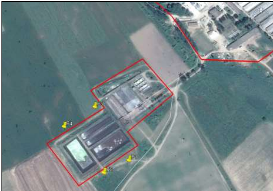
Fig. – Puncte investigate privind calitatea apelor subterane – amonte si aval fata de zona de depozitare dejectii

Monitorizarea calitatii apei freatic pe amplasamentul fermei s-a efectuat conform cerintelor Autorizatiei integrate de mediu nr. SB01/21.01.2015. si conform Autorizatiei de gospodarirea apelor nr. SB94/23.08.2017 (autorizatie care a fost ulterior revizuita, in decembrie 2019).